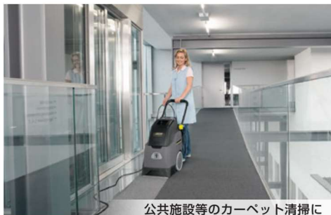
公共施設等のカーペット清掃に