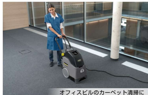
オフィスビルのカーペット清掃に