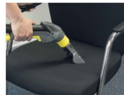
ハンドノズルでシミ取りも効率的