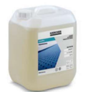
カーペット Pro ディープクリーナー RM 764(10L)