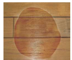
オイルを塗布する