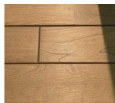
クロスで拭き上げ、乾燥させる