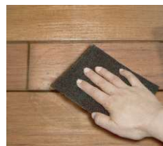
全体をぼかす様にパッドでこする