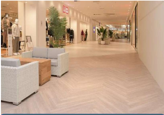
ノンメンテナンス床材