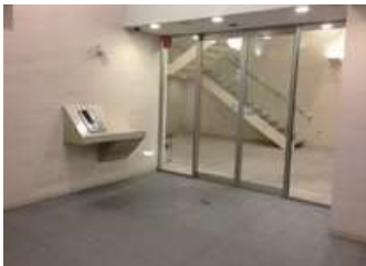
マンションのエントランス