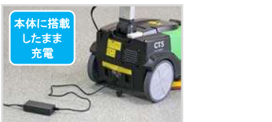
本体に搭載したまま充電