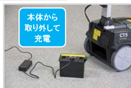
本体から取り外して充電