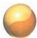
「ウレタンポリマー」