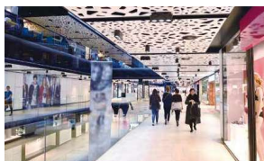
● ショッピングモール