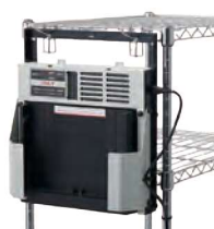
充電台壁掛け金具 * 充電台は別売り