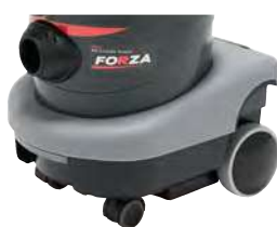
バンパー (シリコン製)