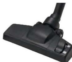
静音フロアノズル